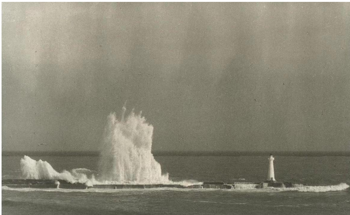
(圖\遇見回欄一百年老店惠比須)

白燈塔帶給花蓮人續航的生命力，就像是犧牲自己照亮別人的熒熒燭光。美術老師將他對白燈塔的思念化為創作藝術的動力，並以他的方式將這樣的回憶記錄下來；楊牧也把對白燈塔的懷念化為創作的動力，悄悄的隱藏的思念，在他的散文裡。在這瞬息萬變的社會中，許多古老的景物被遺忘了，但我至少可以在老師的畫作中在學長的文章裡來緬懷故鄉的過去。雖然我無緣見到白燈塔但是燈塔永遠存在每個花蓮人的心中，不管我們走了多久，走了多遠，始終引領著我們，回到我們的故鄉，花蓮。